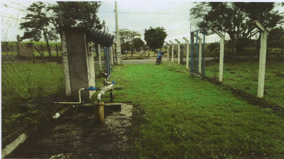
Poço Sítio "São José"